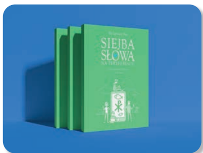
Siejba słowa na peryferiach. Z Ewangelią na Twitterze A.D. 2022, Świdnica 2023, ss. 124.