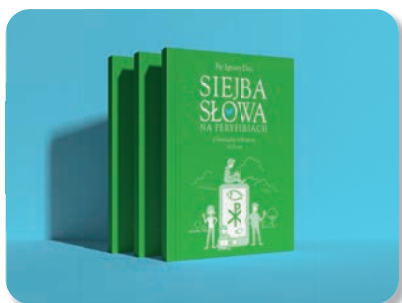
Siejba słowa na peryferiach. Z Ewangelią na Twitterze A.D. 2021, Świdnica 2022, ss. 124.