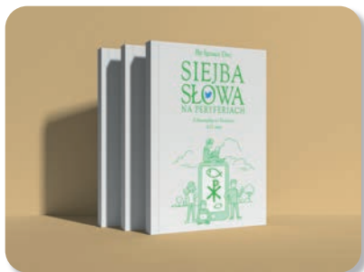
Siejba słowa na peryferiach. Z Ewangelią na Twitterze A.D. 2020, Świdnica 2021, ss. 122.